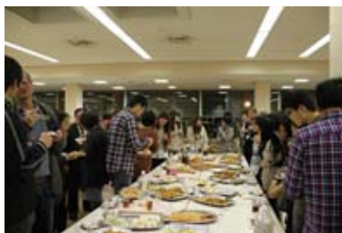
[留学生歓迎会の様子]